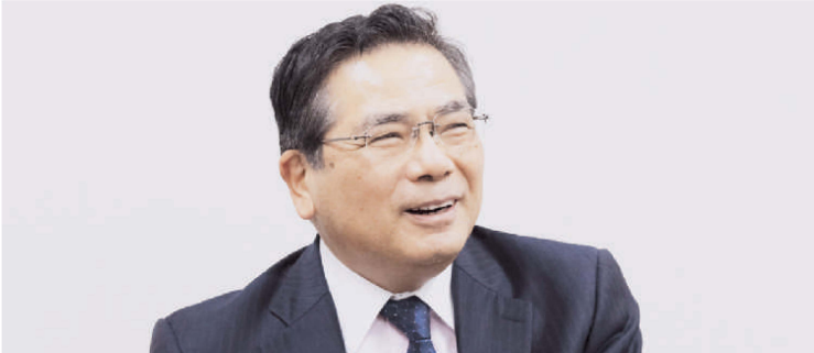
産業技術総合研究所理事長