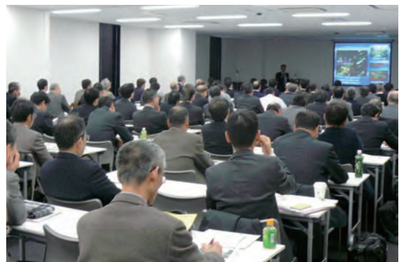
インテリクチャルカフェ