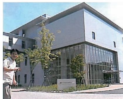
図2 産総研の施設内に起業したベンチャー企業