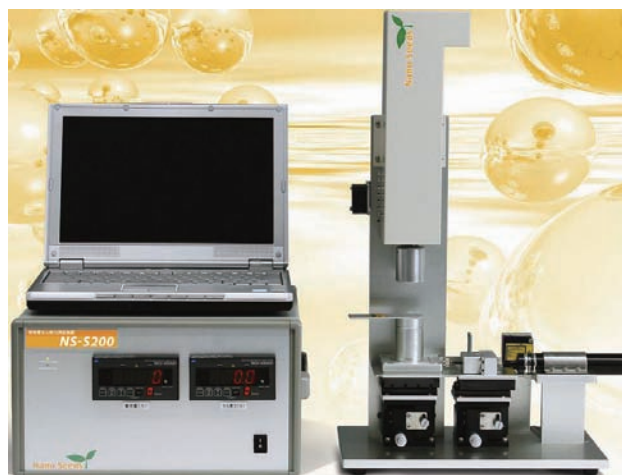
図4 化粧品の使用感（官能試験）を数値化できる評価装置

合成技術を採用してくれたメーカーにとっては、化粧品用の雲母粉体メーカーや化粧品の使用感などを数値化できる評価装置をつくるベンチャー企業