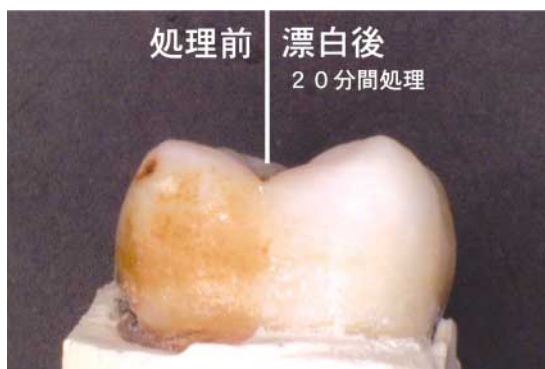
写真1 漂白材を塗布して光(380-420nm)を5分間照射する。これを4回(計20分)繰り返すとかなり変色のひどい歯も漂白された。

このほかにも我々は、歯科医療分野への光触媒の応用として「アパタイトを被覆した二酸化チタン」による入れ歯の洗浄剤や入れ歯のレジンに練り混んで脱臭や汚れ防止抗菌効果を期待できる材料の開発に着手しており、今後これらの研究を積極的に進めていきたい。