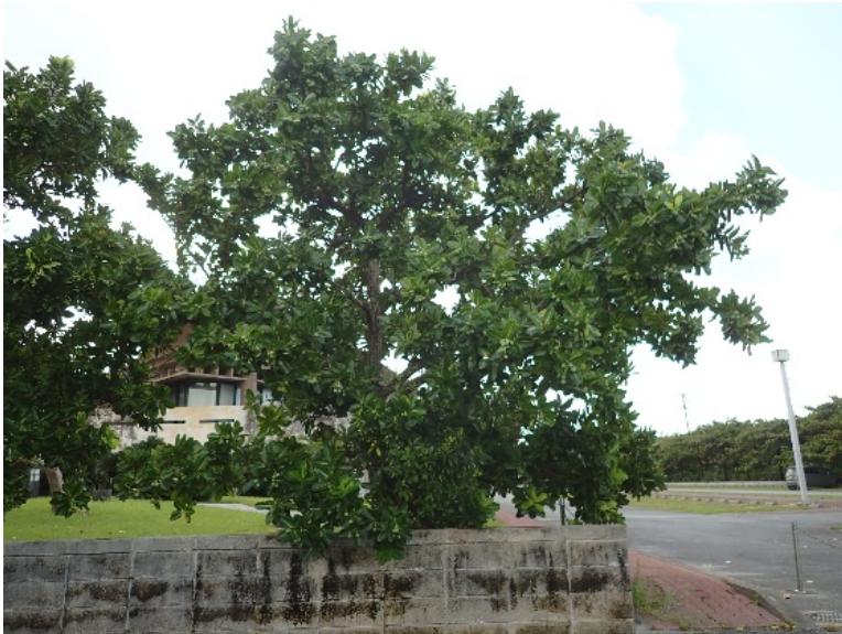
図1 テリハボク ( Calophyllum inophyllum L.) テリハボク科テリハボク属の広葉樹。熱帯アジアやポリネシア、日本国内においては沖縄諸島、先島諸島および小笠原諸島に分布し、樹高20 m以上に成長する。