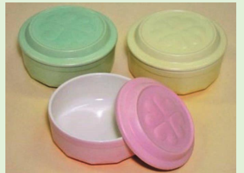
◆5軸加工機で製作したドリッパー ◆低温焼成磁器陶土を用いた手洗鉢 ◆抗菌性陶磁器容器