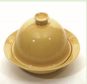
◆ユニバーサルデザイン商品(マグカップ、ポット) ◆電子レンジ対応陶磁器製調理器