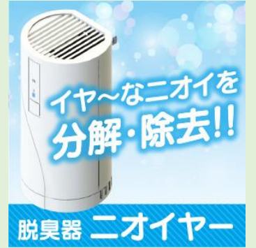
◆透光性磁器製品(フォトセラ、長崎県美術館) ◆蓄光製品(非常用案内板、マーカー) ◆光触媒脱臭器