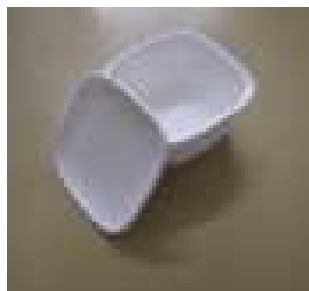
陶磁器製品の見本作製