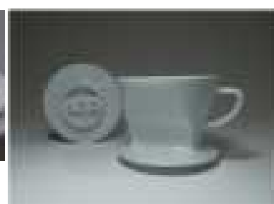
製品化例:カリタ「HASAMI」シリーズ