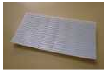
陶磁器製品の原型作製