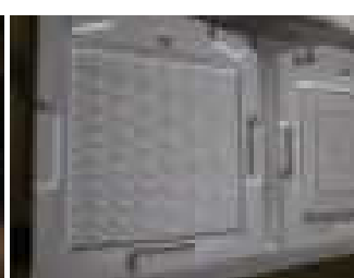
緻密なレリーフの切削加工