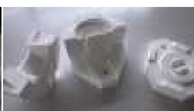
複雑な割型の作製