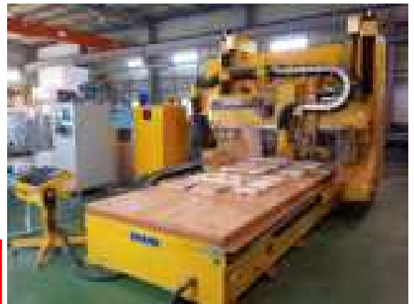
複数台の木型製作用CNC工作機械に取り付けての実証試験