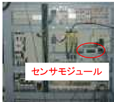
センサモジュール