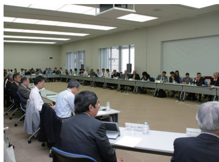
2006 年 ISO/TC229 第 2 回 東京総会 (産業技術総合研究所)