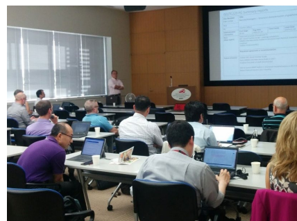
2017 年 ISO/TC229-IEC/TC113 JWG1&JWG2, IEC/TC113 WGs 東京中間会合 (産業技術総合研究所)