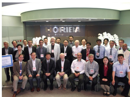
2016年 ISO/TC229 WG3&WG4 京都中間会合 (堀場製作所)