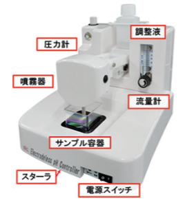
開発した pH 自動調整装置

● 環境基準値の強化に伴い水質分析の高感度化、高精度化への要求が高まっている中、ICP-MS 等の前処理としてキレート樹脂濃縮分離法が公定法に採用された。この方法では、試料 pH が微量金属の回収率に大きく影響を及ぼすが、手動では調整操作が煩雑・不正確等の問題がある。本装置によりキレート樹脂濃縮分離法の普及へと繋がる