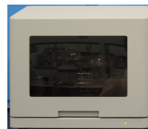
pH 自動調整装置の試作機