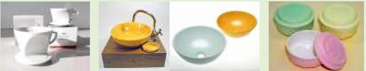
◆5軸加工機で製作したドリッパー ◆低温焼成磁器陶土を用いた手洗鉢 ◆抗菌性陶磁器容器