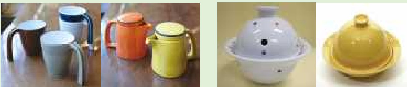
◆ユニバーサルデザイン商品(マグカップ、ポット) ◆電子レンジ対応陶磁器製調理器