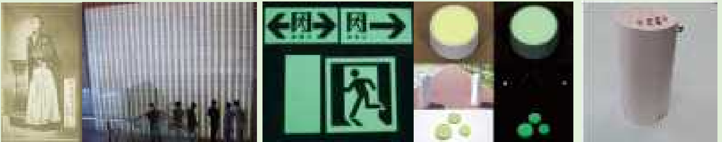
◆透光性磁器製品(フォトセラ、長崎県美術館) ◆蓄光製品(非常用案内板、マーカー) ◆光触媒脱臭器