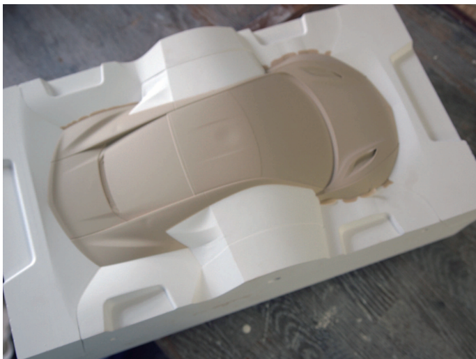
圧力鋳込法によるボディ成型 Molding by Pressure Casting