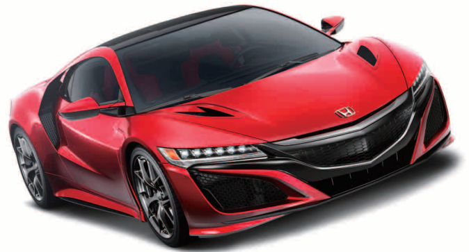
ホンダ NSX / 2015 東京モーターショー出品車

This project is supported by Honda R&D Co., Ltd. Produced from real 3d data of the production car. Utilizing Our Digital Technology.