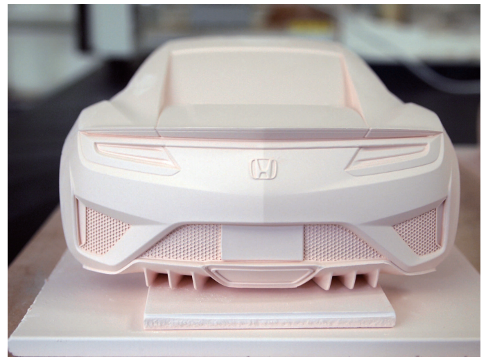
素焼後のボディ Biscuit Fired Body