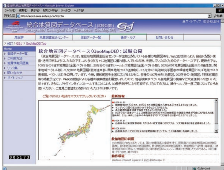
図1 GeoMapDBのトップページ

地質調査総合センターでは、地質関連のデータベース全体を、「総合地質情報データベース（GEO-DB）」と呼び、各種の既存の印刷物、CD-ROMなどの出版物、研究資料集、RIO-DB上の各種のデータベース、GeoMapDB