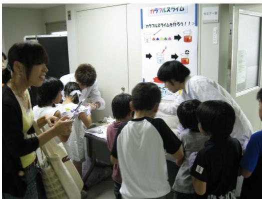
カラフルスライム