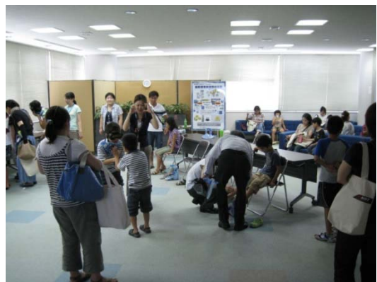
くらしと標準化のかかわり～高齢者体験他～