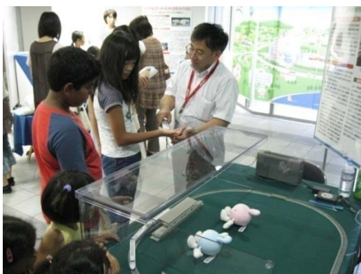
キンデン(筋電)で模型電車を動かそう！