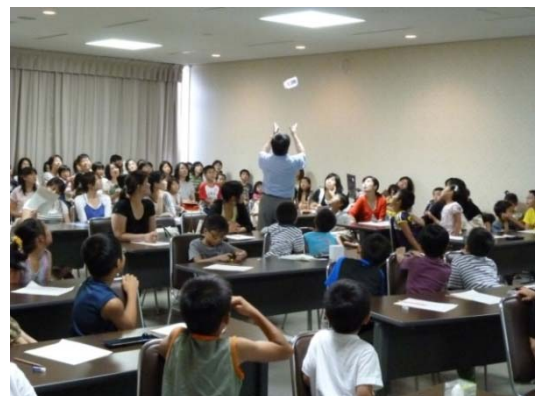
無重力を体感する

平成22年8月25日(水)、産総研四国センターでは、社会及び地域に貢献する産総研をより多くの方々にご理解いただくため、また、青少年に科学の面白さを理解してもらい、科学技術への関心を高めてもらうことを目的に「一般公開」を開催いたしました。当日は天候にも恵まれ、また猛暑にもかかわらず、約450名の方にご来場いただき大変盛況でした。皆様、ありがとうございました。