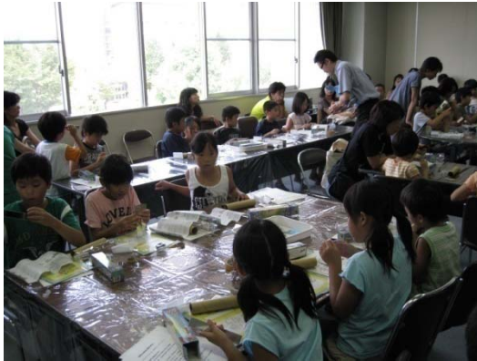
光の不思議～万華鏡工作教室～