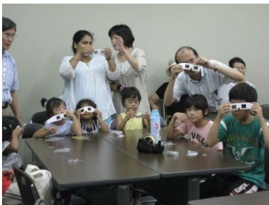
立体映画で体験する偏光の不思議