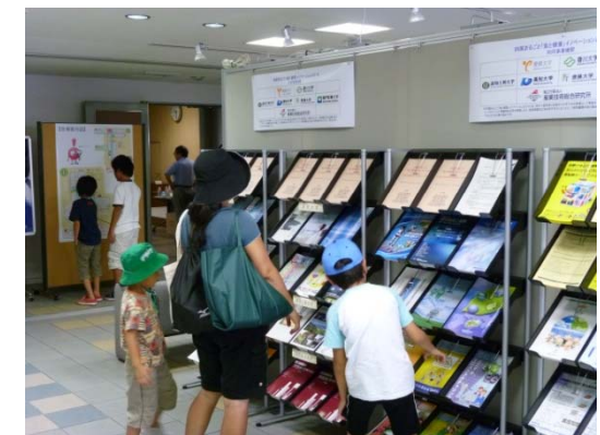
四国センターの研究紹介他