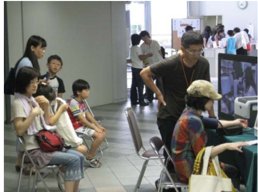
血管年齢測定装置