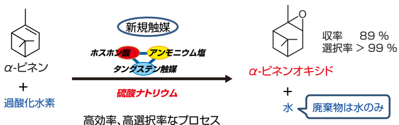
図 2 今回開発した過酸化水素を用いる \alpha -ピネンのエポキシ化反応