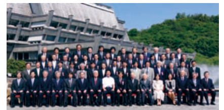
功労者表彰の集合写真

さらに、独立行政法人の技術移転について意見交換を行うワークショップもあり、産総研の産学官連携の取組みを紹介するとともに、他発表者を交えたディスカッションも行われ、今後の技術移転についてのトップ会談および対外的なメッセージ発信の格好の場となりました。