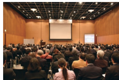
満席のシンポジウム会場

エンス分野の新戦略とトピックスの紹介、ならびに幹細胞の規格化・標準化および分化制御を目標に新たに発足した幹細胞工学研究センターの概要と重点テーマを紹介するという趣旨で開催されました。フロアからの熱心な質疑も行われ、アンケート結果では、95%の方がライフサイエンス分野の紹介に満足したと回答され、シンポジウムの目的は達成されました。今後もこのようなシンポジウムを継続して開催してほしいという声も多く寄せられました。