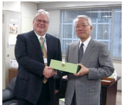
CNRS アラン・フックス理事長(左)と野間口理事長

イベントの詳細と最新情報は、産総研のウェブサイト(イベント・講演会情報)に掲載しています http://www.aist.go.jp/