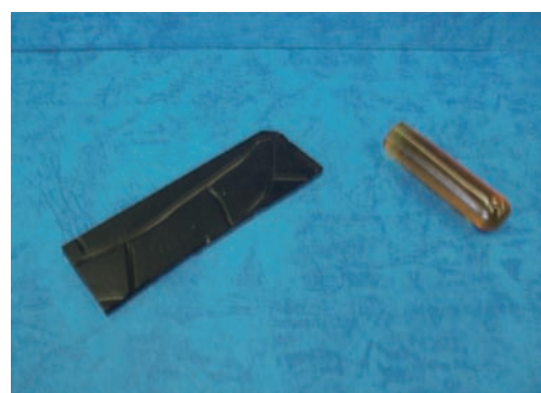
図2 糖類およびリグニンから得られたエポキシ硬化物