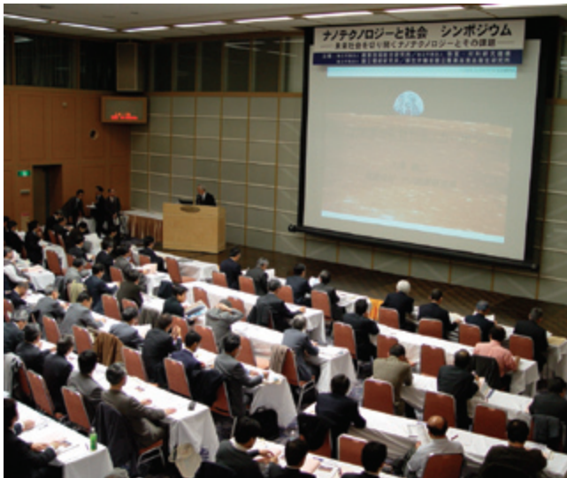
2005年2月1日のシンポジウム「ナノテクノロジーと社会」基調講演

タが大きく取り上げられるなど、健康への影響や環境への影響等を懸念する声もあります。そのため欧米諸国を中心に本技術が社会に与える様々な影響（経済、環境、健康、倫理）を評価する活動が活発になっています。