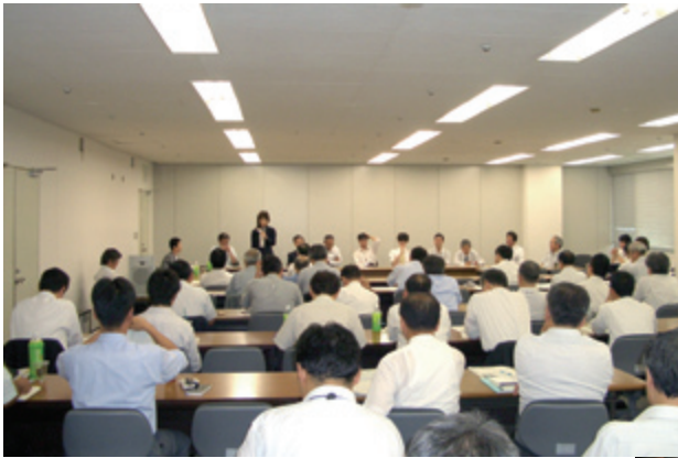
2005年9月2日の第1回ワークショップ