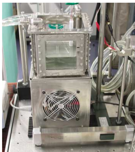
写真1 超音波照射（ソノケミカル）反応装置

このような錯体を含む溶液に超音波を照射することによって、反応溶液を不安定化し、析出反応を誘発しようというものである。現在のところ析出機構の詳細は明らかではないが、特定のpH、温度、化学種濃度で水酸化亜鉛膜をガラス板などの表面に10分程度の短時間で析出させることが可能である。このようにして得られた膜を200℃で熱処理することにより、写真2に示すような酸化亜鉛膜を得ることができた。得られた膜は、数ミクロンの厚さを持ち多孔質であることから触媒やセンサーなど、広範な産業応用が期待されている。