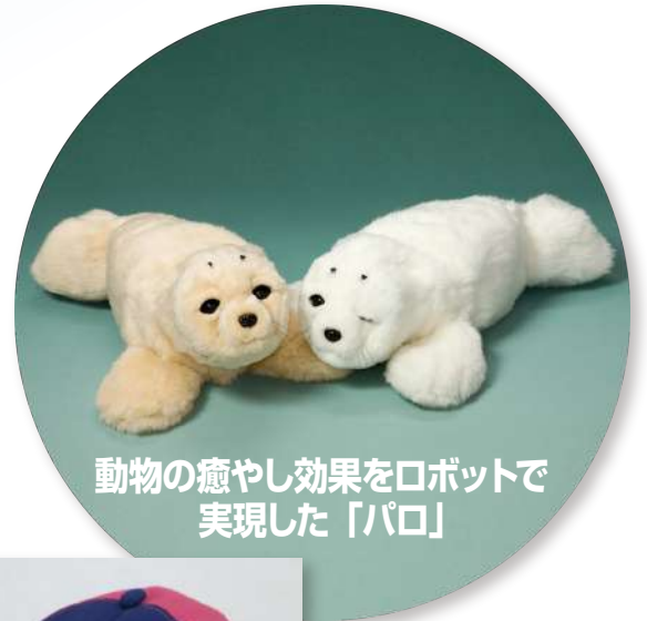
動物の癒やし効果をロボットで 実現した「パロ」