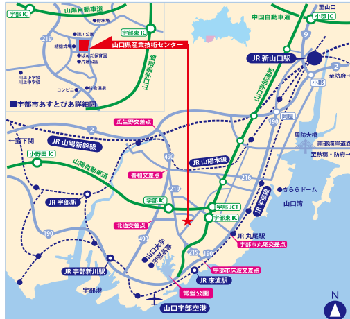
山口県産業技術センター案内図